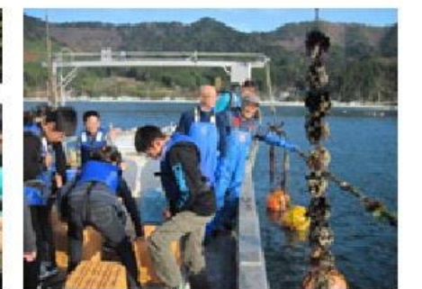
雄勝での体験学習