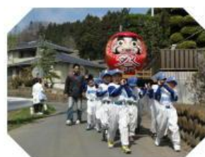
此頃の「だるまみこし祭り」