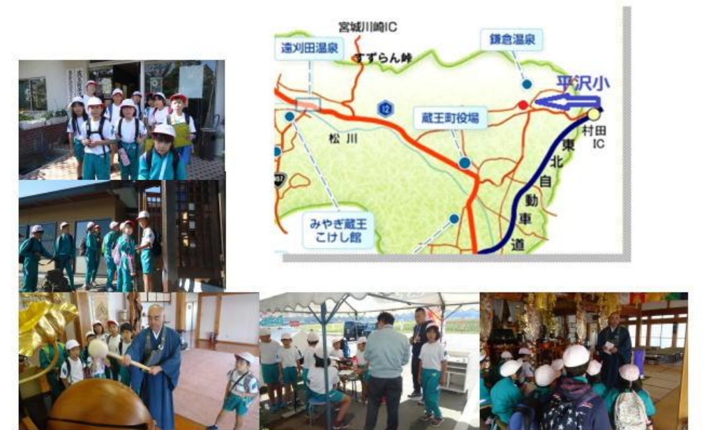
ふるさと探検「アクティブウォーキング」