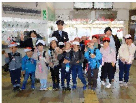
1・2年校外学習 (白石方面)