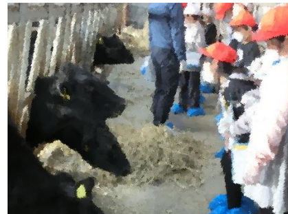
3年校外学習 (蔵王爽清牛)