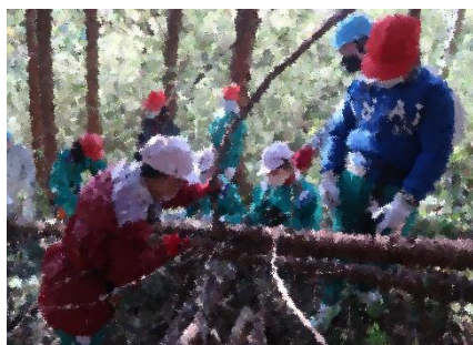
5・6年学校林活動 (柴田農林高と)