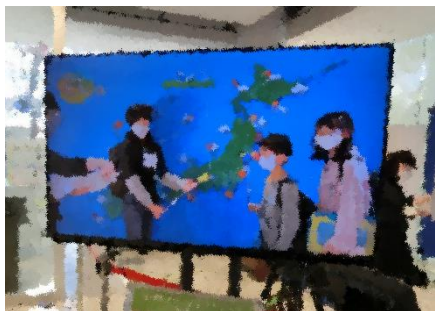
5年校外学習 (仙台方面)